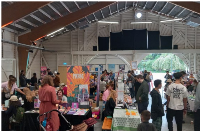
Malmö seriefest 2023

Serieförbundet deltog aktivt under ett flertal festivaler och seriemässor under 2023. Vi deltog på och samarbetade med festivaler som Malmö seriefest, Uppsala Comix och hade en aktiv roll i arrangerandet av Skillinge seriefestival som hålls på Österlen varje år. Under Heroes Comic Con i Stockholm fanns vi representerade med en egen monter bemannad av volontärer från våra medlemmar och erbjöd även våra yrkesaktiva medlemmar att delta med en exklusiv bordsplats tillsammans med oss. Vi har inlett en dialog med den nya fansinfestivalen Stockholm Zinefest samt med Skillinge Seriefestival för att utöka vårt samarbete med dem.