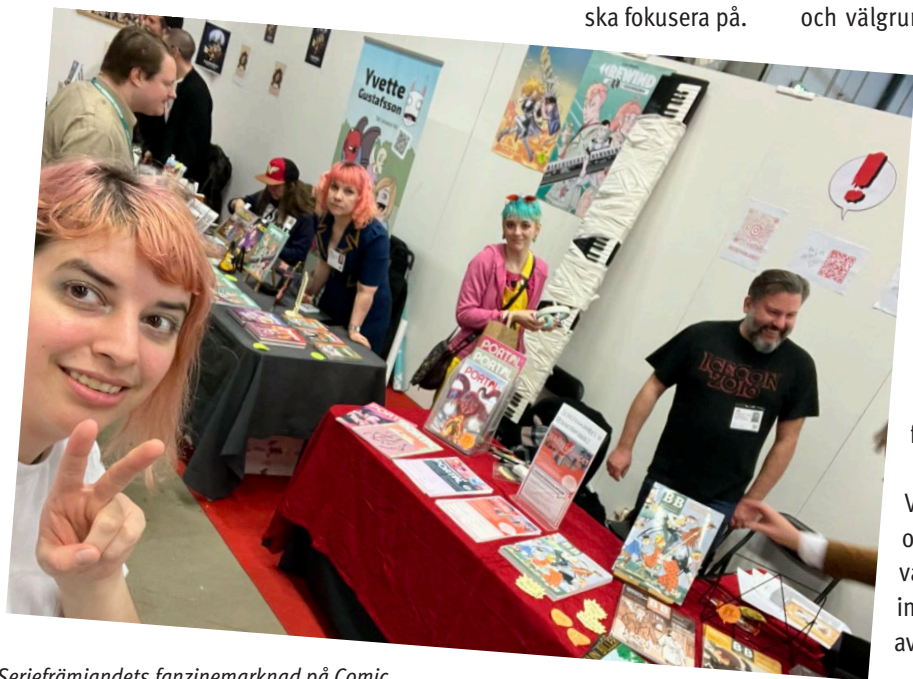
Seriefrämjandets fanzinemarknad på Comic Con Stockholm 2023.

Vi har dessutom medlat mellan uppdragsgivare och yrkesaktiva medlemmar i Skåne och livesänt våra samtal som hållits på Rum för serier så att inte bara deltagare bosatta i Malmö kunnat ta del av innehållet.