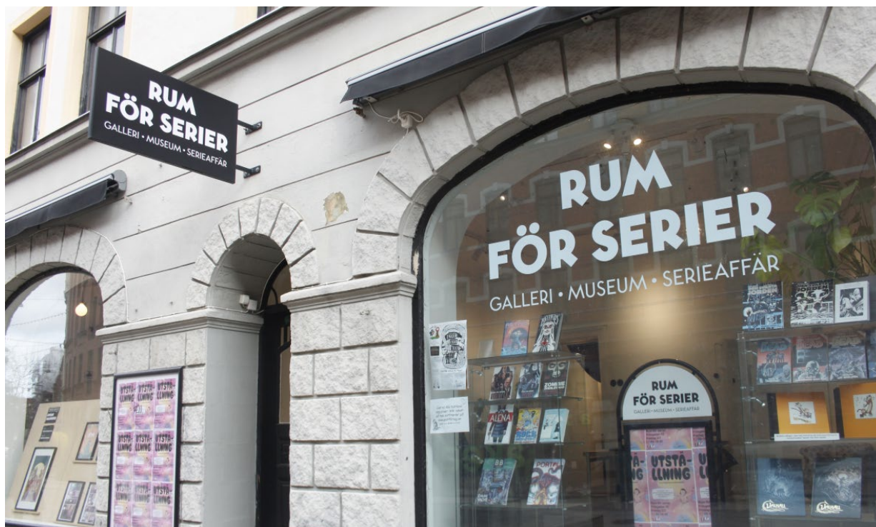
Rum för serier

Under 2022 togs en rad olika beslut för att få föreningen på fötter igen efter en tuff ekonomisk period då den var på väg mot att gå med underskott.