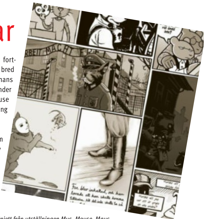
Vinjett från utställningen Mus, Mouse, Maus

Vandringsutställningarnas format är rollups som kan skickas mellan platser och monteras upp av extern part eller skickas dit av projektledare.