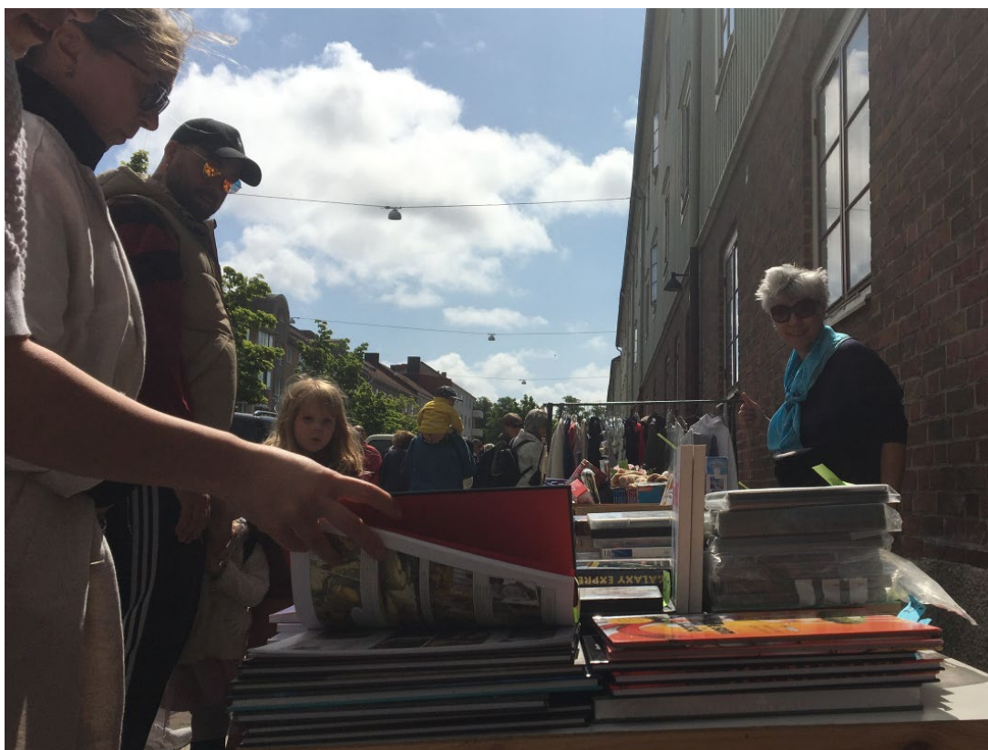
Majornas Mega-loppis, SeF Göteborg.