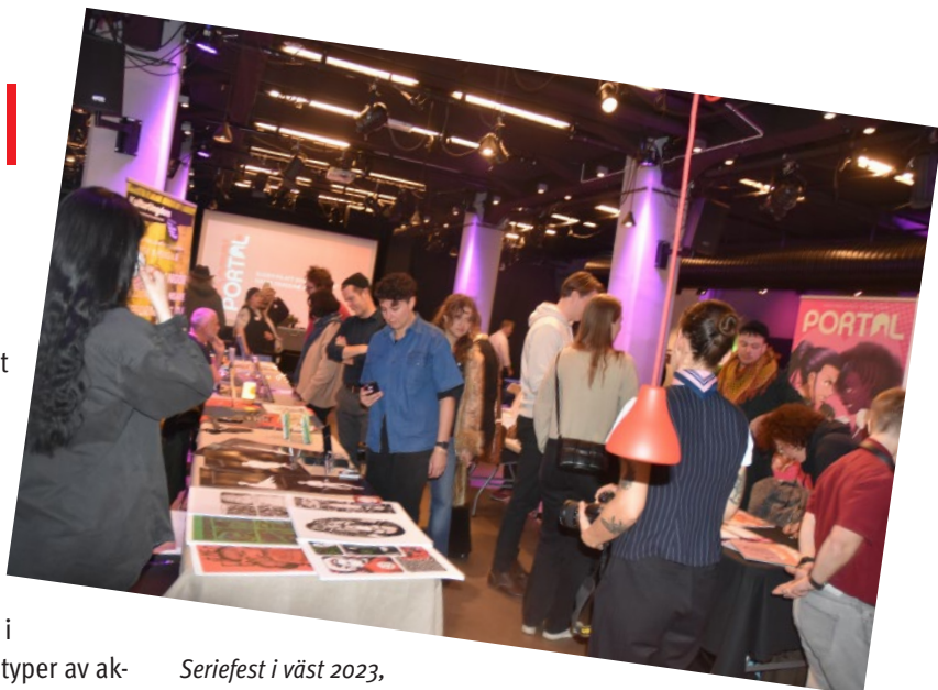
Seriefest i väst 2023

Det hölls workshops på en rad platser, utställningar, biblioteksprogram med läsfrämjande insatser, skolprogram, en akademisk dag, scenprogram och marknad och Pecha Kucha (en föreläsningsform som nyttjar bildberättande) med serietema. Vi genomförde också en serietävling på temat "Lärande".