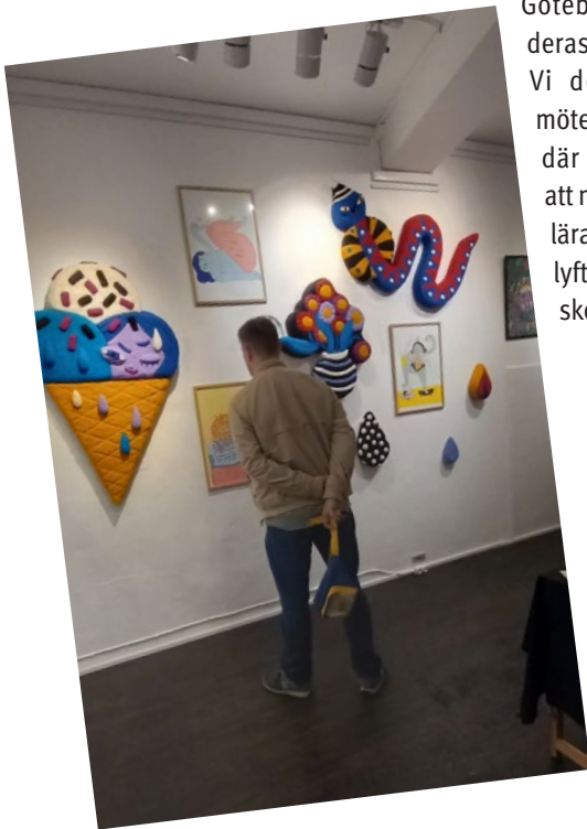
Gallerighelgen 2023 på Rum för serier.

Göteborg för att lyfta deras arbete i Malmö. Vi deltog också på mötesplatsen Spraak, där vi fick möjlighet att nå ut till elever och lärare i Malmö för att lyfta serieteckning i skolan.