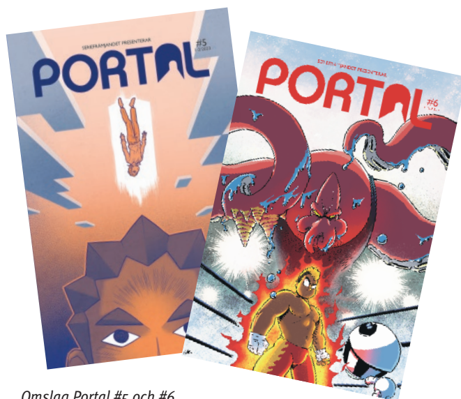
Omslag Portal #5 och #6