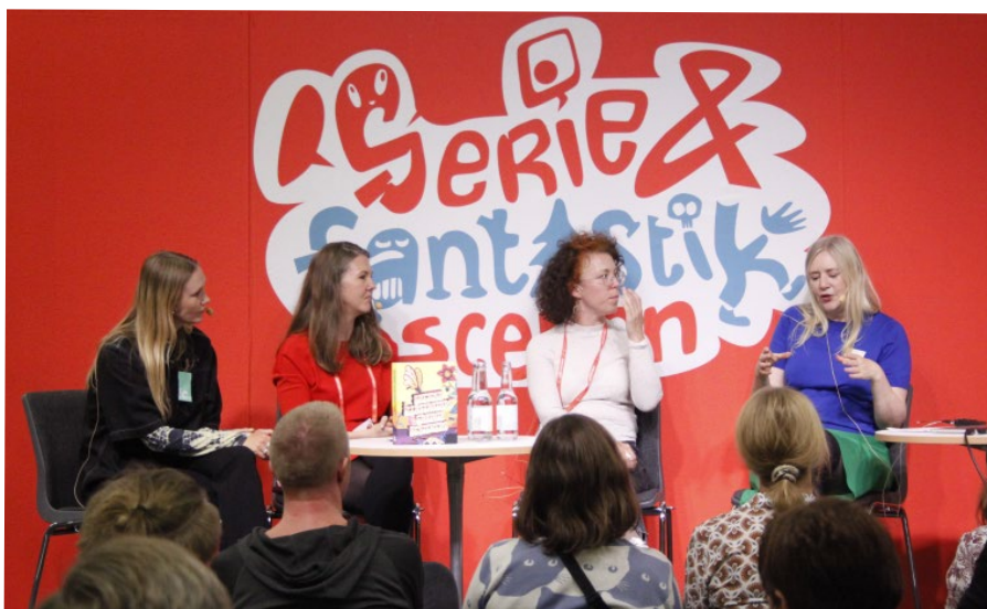
Seriefest i Väst 2023

Detta år tillsattes en extern projektledare och slutresultatet blev oerhört uppskattat. Antalet besökare vid scenen slog rekord. Det blev ett fullspäckat program med allt från Brasilianska serieskapare till Kalle Anka-tecknare och Mårten Melin. Under 2023 fördjupades samarbetet med Bokmässan och arbetet med att utveckla serieområdet kommer ske i högre grad framöver.