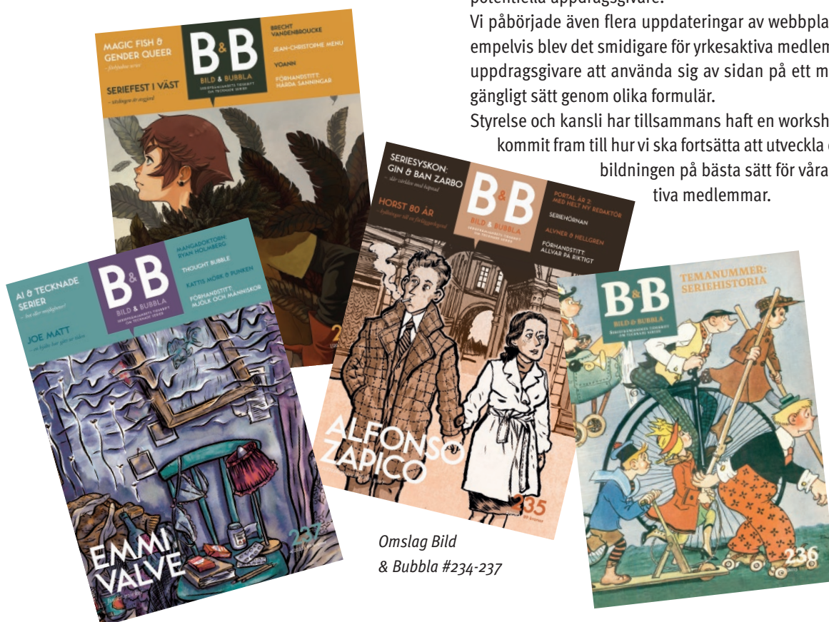
Omslag Bild & Bubbla #234-237

Styrelse och kansli har tillsammans haft en workshop där vi kommit fram till hur vi ska fortsätta att utveckla centrumbildningen på bästa sätt för våra yrkesaktiva medlemmar.