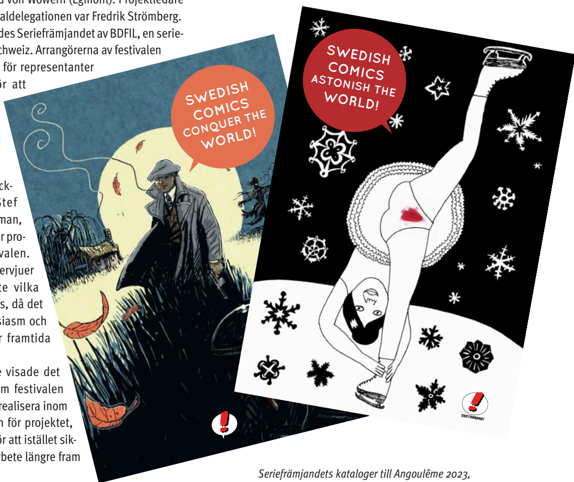
Seriefrämjandets kataloger till Angoulême 2023, Omslagsillustration: Dennis Gustafsson respektive Liv Strömqvist

Under samtliga festivaler tog vi med exemplar av våra två kataloger som syftar att lyfta en rad svenska serieskapare utomlands. Både kansli och styrelse har inkommit med feedback för att uppdatera och diversifiera katalogerna, som trycks i samarbete med föreningen Seriearkivet.