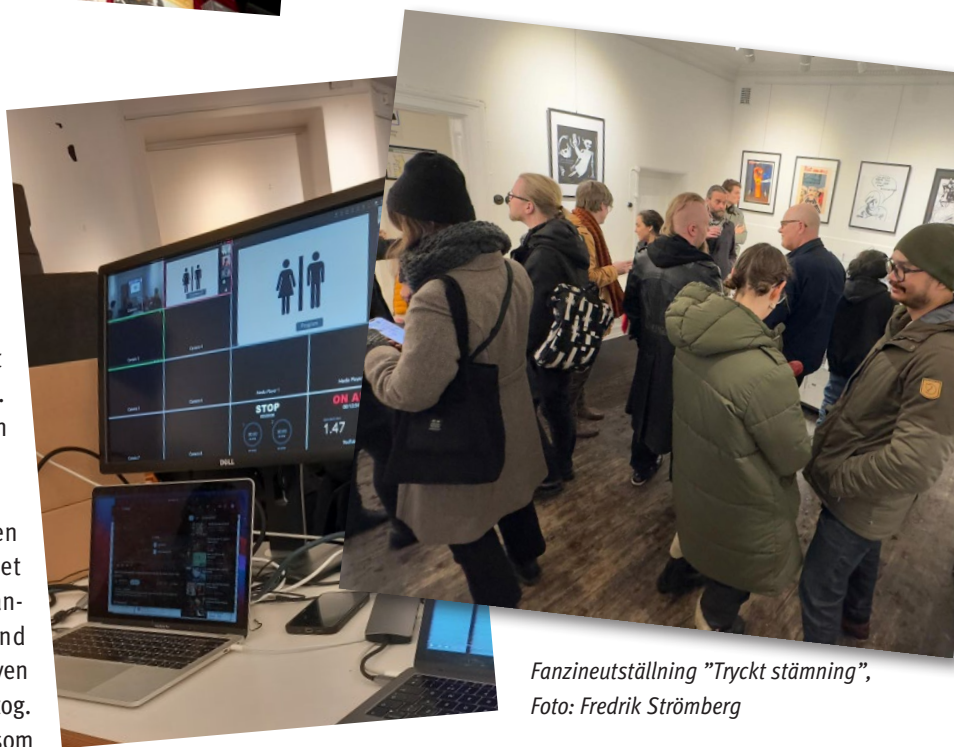
Fanzineutställning "Tryckt stämning"

Fyra medlemmar deltog och lyftes även i Seriefrämjandets digitala kanaler. Det fanns ett bord för föreningen som bemannades av volontärer (rekryterade bland Seriefrämjandets medlemmar) och som även var behjälpliga för de yrkesaktiva som deltog. En enkät skickades ut efter mässan till de som valt att delta, och en stor majoritet svarade att deras upplevelse varit positiv.