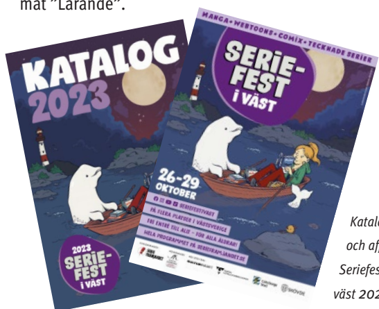
Katalog och affisch Seriefest i väst 2023