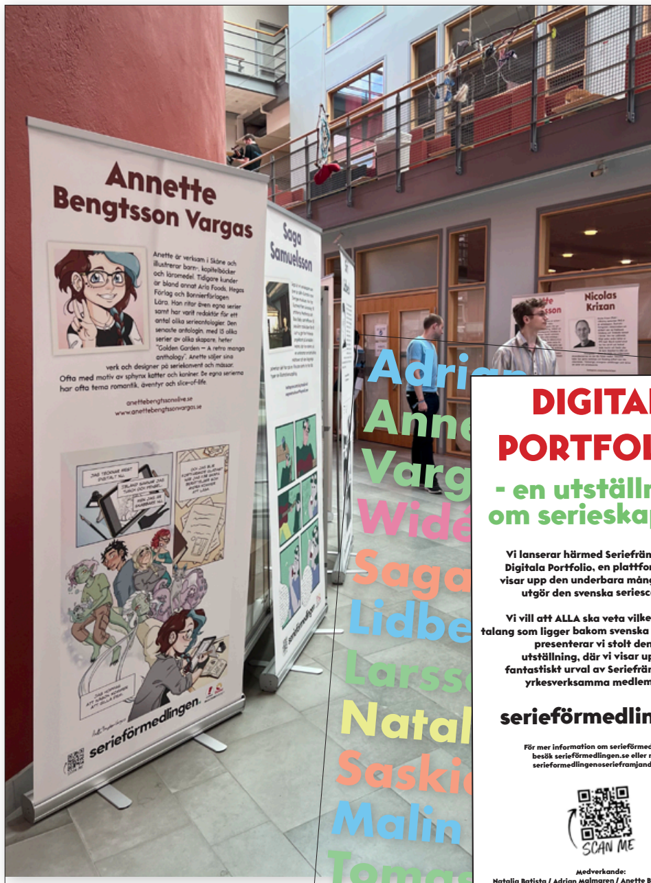
Bild från Serieförmedlingens fysiska portfolio-vandringsutställning på Närcon Sommar 2022 (Foto: Stef Gaines, t.v.). Det togs även fram en broschyr för den digitala portfolion, som presenterar serieskapare via en digital portfolio.