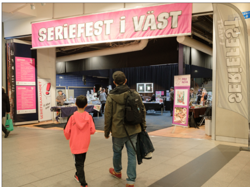
Seriefest i Västs pop-up-butik i Nordstan i centrala Göteborg. Här fanns både marknaden och en rad olika programpunkter.

För andra året i rad arrangerade festivalen en tävling, med 12 vinnare som publicerades i Bild & Bubbla nr 1 / 2023.