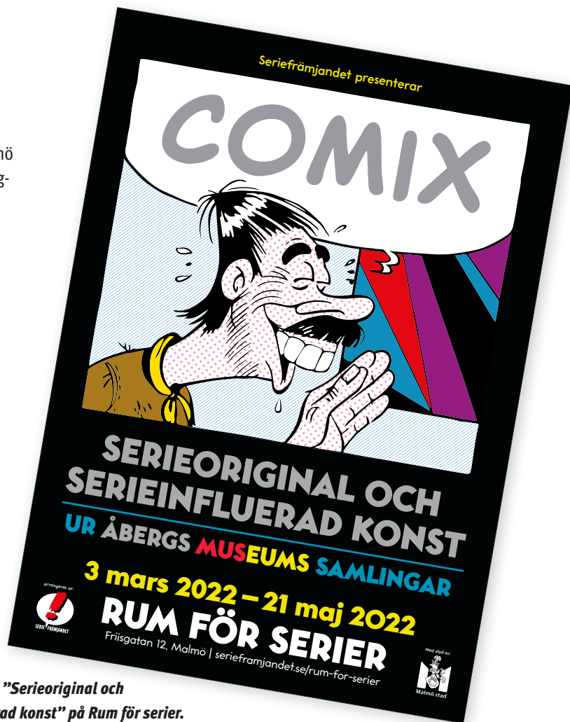
Affisch från "Serieoriginal och serieinfluerad konst" på Rum för serier.

Under året hölls även direktsända panelsamtal och diskussioner i en digital satsning som kommer att fortsätta under 2023.