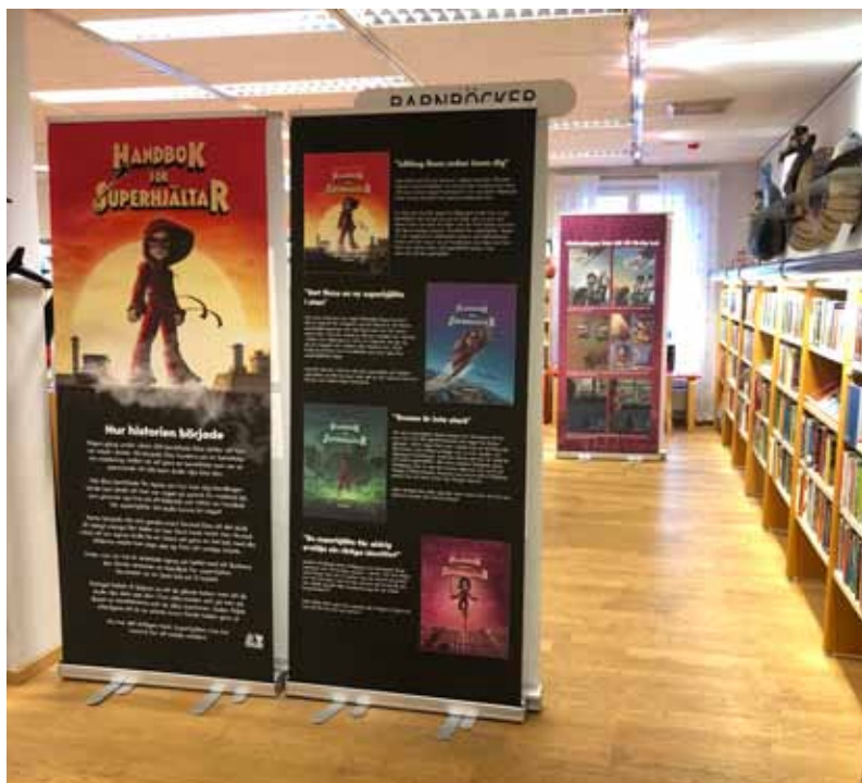
Vandringsutställningen Handbok för superheltar på biblioteket i Borgholm. Superhjälmasker från en workshop på biblioteket i Kumla.