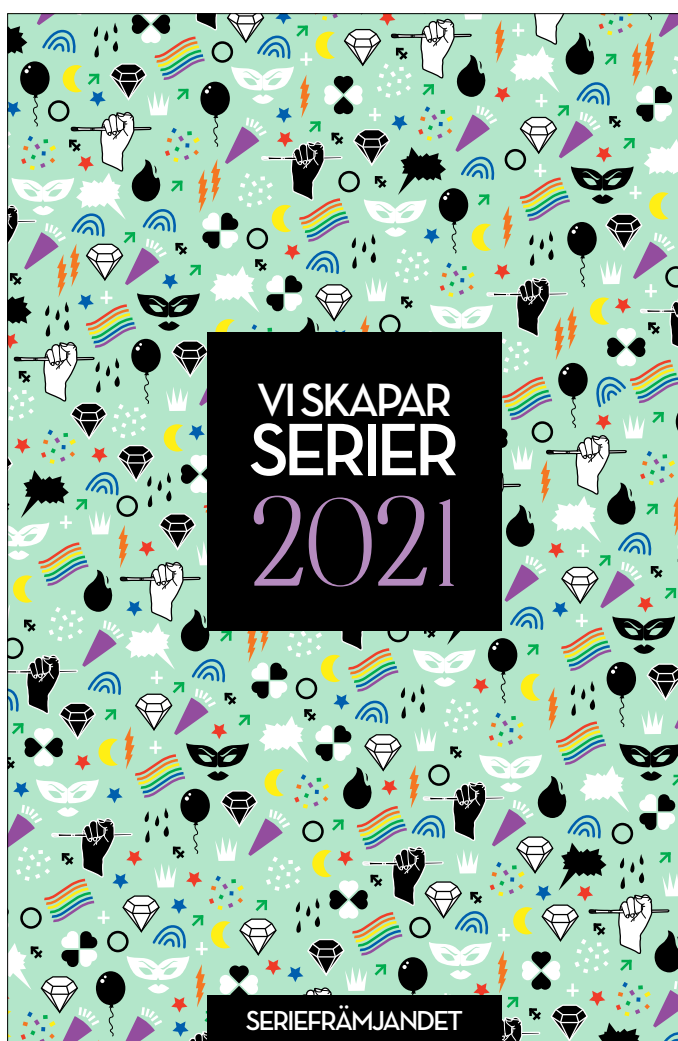
Nästa års katalog från Serieförmedlingen togs fram under 2020.

Vi har också haft förmånen att samarbeta med Författarcentrum Syd och Centrum för Dramatik Syd. Vårt inplanerade och fullbokade evenemang "Läsdagen" för lärare fick ställas in p.g.a. covid-19. Istället arrangerade vi digitala workshops med syftet att erbjuda kompetensutveckling för medlemmar inom våra fält litteratur, dramatik och förstas serier.