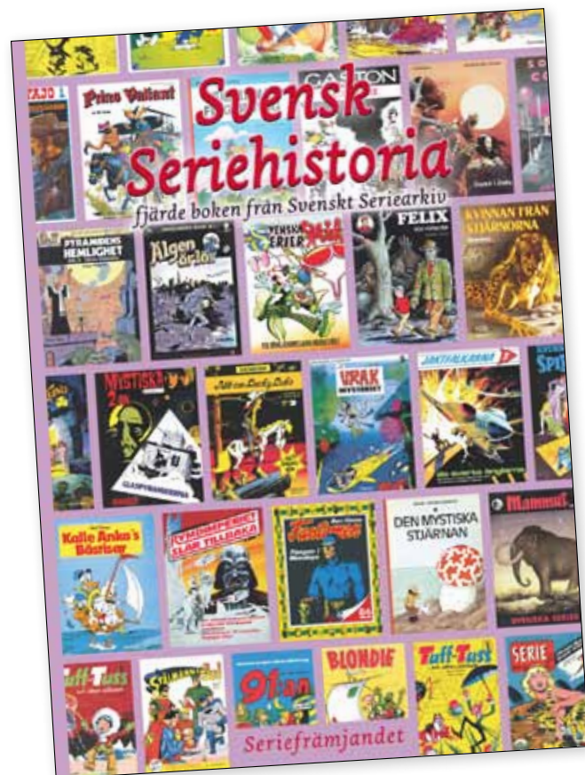
Den nya och fjärde boken om svensk seriehistoria från Svenska Seriearkivet.

Seriefrämjandet vandringsutställningar, som åker land och rike runt, har visats i ganska hög utsträckning, pandemin till trots. Utställningar har kunnat besökas av enskilda personer och små grupper och utspritt över tid. För året har visningar skett på platser som Horndal, Mora, Borgholm, Fagersta, Lycksele, Västervik, Norrköping, Sundsvall, Sandviken, Sveg, Mörbylånga och Kumla.