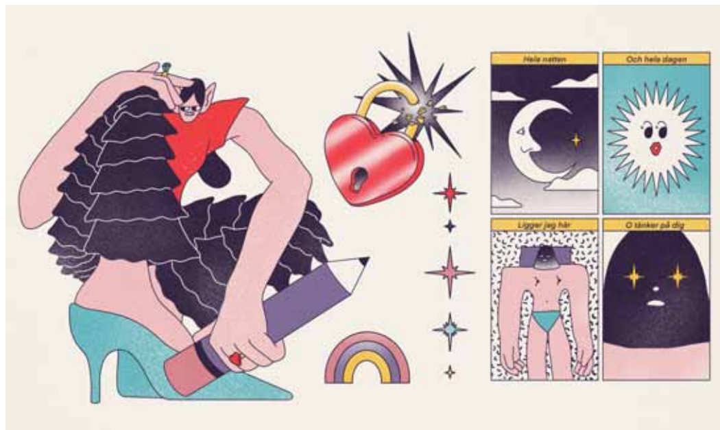
Illustration till SIS 2020 av Moa Romanova.

Serier från de nordiska länderna, som projektet heter på svenska, var en avslutning på senaste årens satsning mot den franska seriemarknaden. För tredje året anordnades ett samnordiskt projekt på den franska seriefestivalen i Angoulême. Det organiserades en monter med bokbord och signeringar, ett scenprogram med ett stort antal evenemang, en internationell förläggarfrukost, med mera. Deltog gjorde ett antal serieskapare, förläggare och redaktörer från samt-