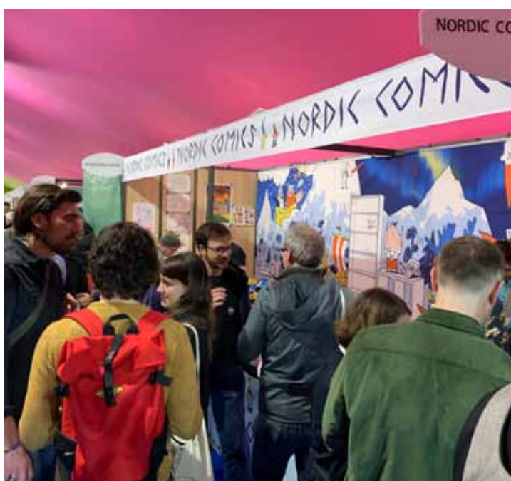
Mingelbilder från Angoulême i januari/februari, precis innan pandemin slog till och gjorde festivaler omöjliga under resten av året.

Seriefrämjandet hade planerat att genomföra en gemensam nordisk satsning på den inflytelserika Toronto Comic Arts Festival (TCAF) i Kanada, och på plats arbeta vidare med att lyfta fram nordiska serier internationellt på samma sätt som vi gjort i Frankrike i många år. Pandemins nedslag gjorde dock att insatserna istället fick handla om ett förberedande arbete i syfte att lägga grunden för en större satsning 2022, då nordiska serier blir tema på TCAF. Inom projektet har det producerats såväl foldrar som utställningar som lyfter fram svenska och nordiska serier.